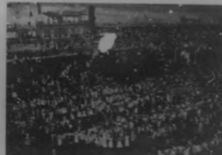
El Festival de "Bohemia" á los niños.—Un momento del momento de entrega de los juguetes á los niños de la ciudad.

ella todo el peso de su influencia y el resorte de las simp- tías y afectos con que cuenta en nuestra buena sociedad, y muy pronto vióse rodeada de distinguidas damas y seño- ritas que, con sus generosas donaciones primero, y con su