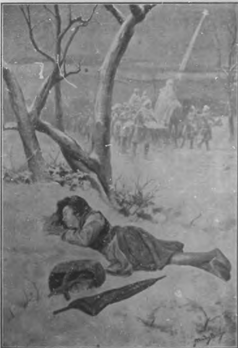
LOS REYES.—EL SUEÑO DE UN POBRE, dibujo de Mónica Branga.