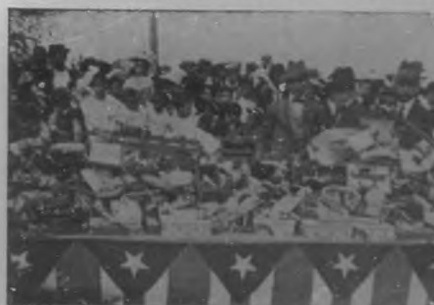
El Festival de "Bohemia" á los niños.—Una parte de la gran masa que conlleva más de 25,000 juguetes.