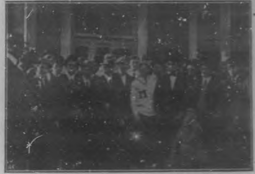
Los jugadores del team de Foot Ball de la Universidad del Municipio, con el pasado domingo jugaron derrotado al Club Atlético en un match celebrado en el Estadio Park.