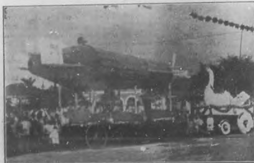
Los Festejos de Caibarión.—Cetra representando un dirigible "Zepelín". (Véase á Través de la Isla)

Con un barquete para la prensa inauguró el servicio completo el Hotel Miramar, punto de agradable reunión de la sociedad elegante.