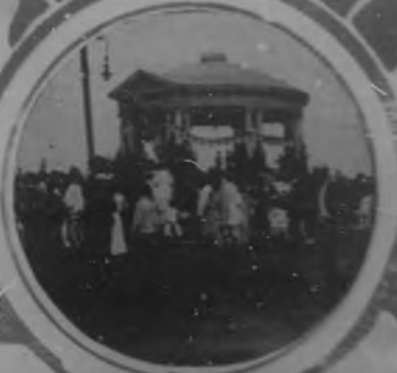
EL FESTIVAL Diversos aspectos de las escuelas pú- blicas. San de Solano.