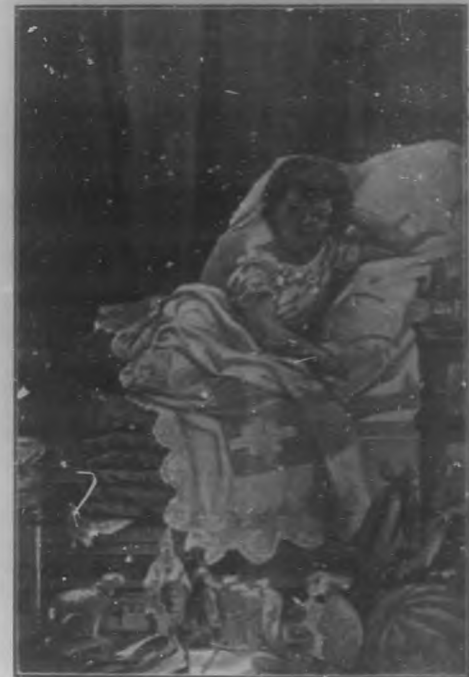
LOS REYES.—EL SUEÑO DE UN POBRE, dibujo de Mónica Branga.

La anciana les explica que no es posible que los niños puedan ver los Reyes Magos porque vienen á muy altas horas de la noche, cuando ya duermen todos ellos, y por eso sólo ven á los papás y abuelos para pedirles digan á los niños que sean buenos, que respeten y veneren á sus padres, á los mayores y ancianos; que quieran á sus hermanitos; que estudien y que